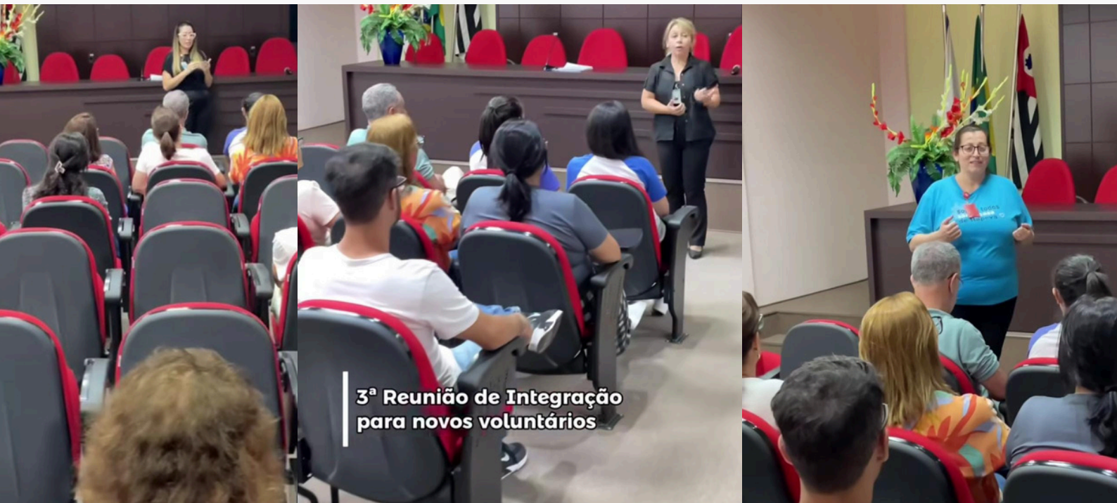
3ª Reunião de Integração para novos voluntários

Tivemos a alegria de realizar a 3ª Integração para Novos Voluntários, um momento especial que reuniu corações e mentes dispostos a fazer a diferença. Foi uma oportunidade incrível de aprendizado e troca de experiências, onde novos e antigos voluntários compartilharam suas histórias, desafios e conquistas.